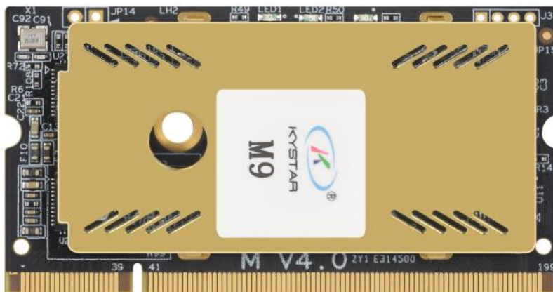
图 1 M9 接收卡正面图